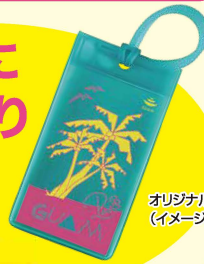
オリジナルグッズ (イメージ)

※pecoさんスペシャルトークショーにご参加いただいた方の中から、 各回5名様にプレゼントが当たる企画をご用意しております。